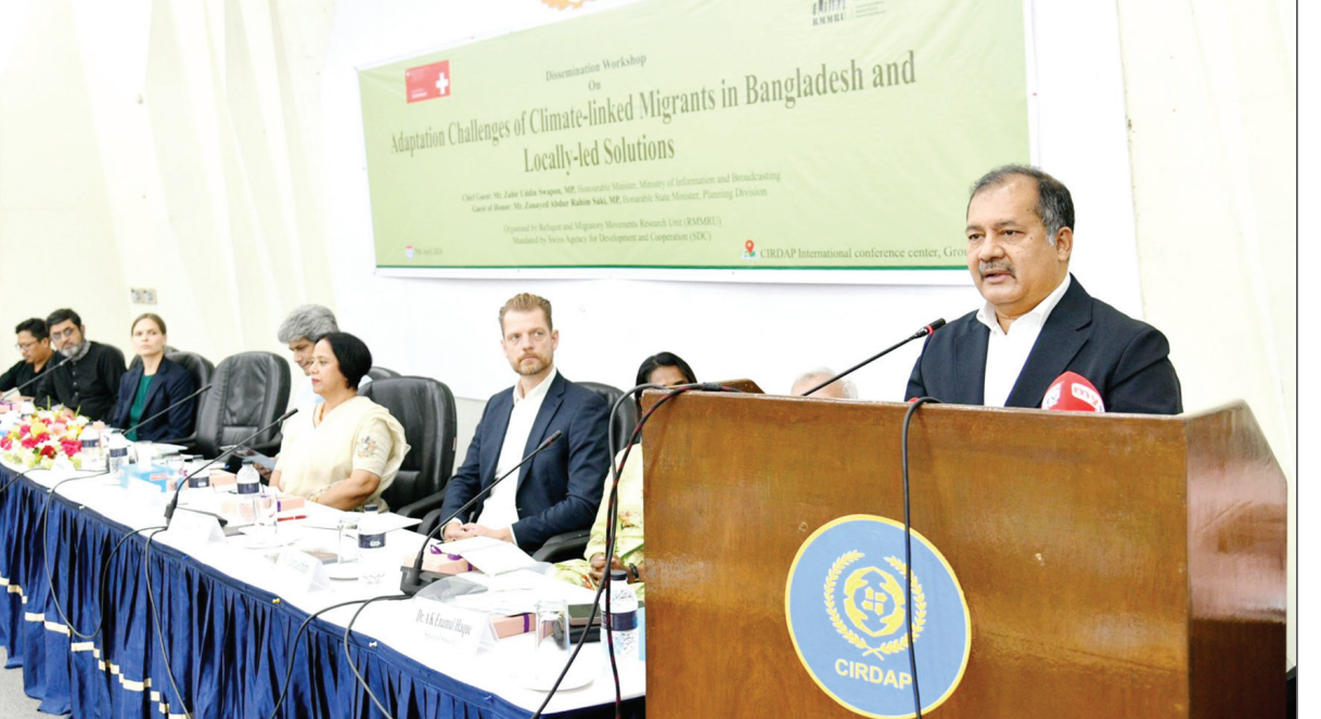
গতকাল রাজধানীর সিরডাপ মিলনায়তনে রিফিউজি অ্যান্ড মাইগ্রেন্টস মুভমেন্টস রিসার্চ ইউনিট আয়োজিত এক কর্মশালায় প্রধান অতিথির বক্তব্যে রাখেন তথ্যমন্ত্রী জহির উদ্দিন রুপন।

তথ্য ও সম্প্রচার মন্ত্রী জহির উদ্দিন রুপন বলেছেন, জলবায়ু পরিবর্তনজনিত কারণে যারা বাস্তুহীন হয়ে শহরে আসছেন; তাদের সমস্যাকে কেবল মানবিক বা আত্মপোষণীয় সমস্যা হিসেবে দেখলে হবে না। এটি জননীতির (পাবলিক পলিসি) গুরুত্বপূর্ণ একটি বিষয়। তিনি আরও বলেন, এই অভিবাসন প্রক্রিয়ায় চলমান উন্নয়ন প্রক্রিয়ার সঙ্গে অন্তর্ভুক্ত করা এখন সময়ের দাবি। গতকাল (মঙ্গলবার) সকালে রাজধানীর সিরডাপ মিলনায়তনে রিফিউজি অ্যান্ড মাইগ্রেন্টস মুভমেন্টস রিসার্চ ইউনিট (আরএমএমআরইউ) আয়োজিত এক কর্মশালায় প্রধান ২ এর পাতায় দেখুন